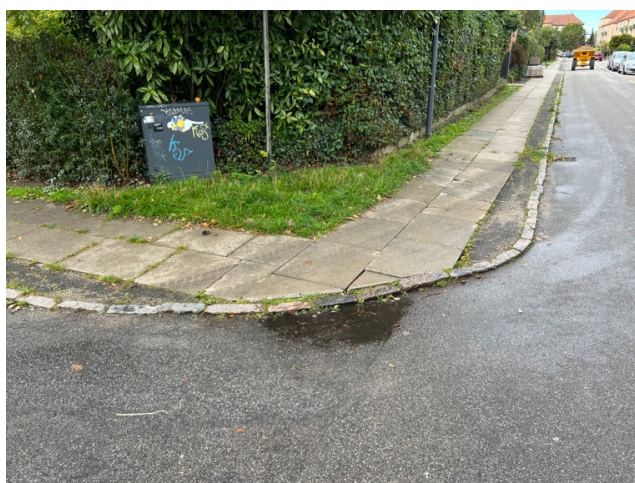
Frit omkring vejskilte og lygtepæle