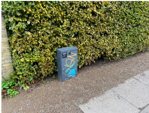
Frit omkring teknikskabene fra fx Dong Energy